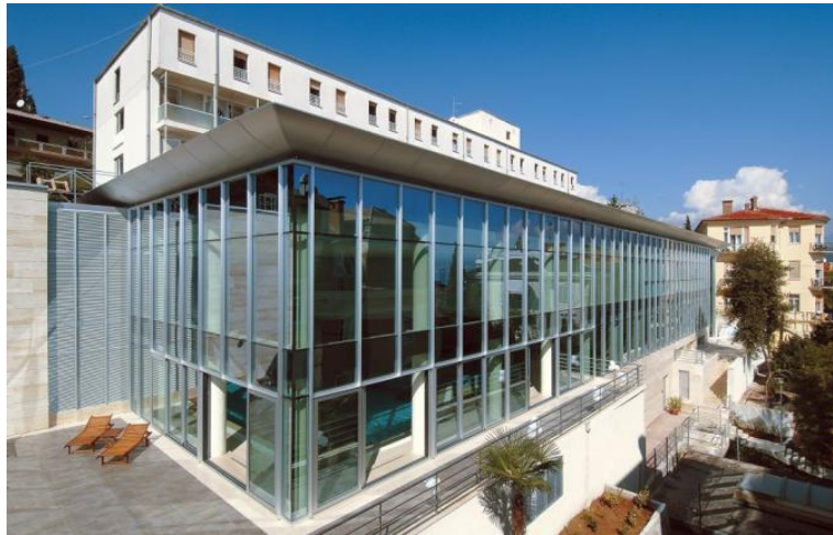
Slika 3. Thalasso Wellness Centar Opatija