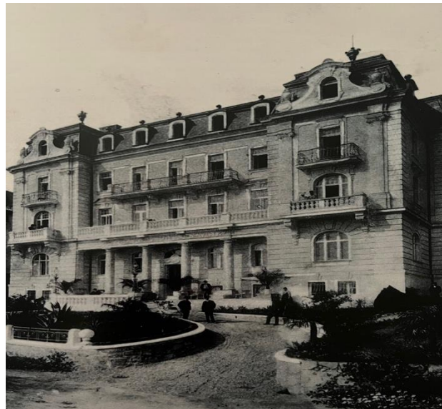
Slika 2. Villa Speranza (danas Villa Dubrava) prvi lječilišni hotel u Hrvatskoj

Izvor: Bratović, Thalassoterapija Opatija , 25.