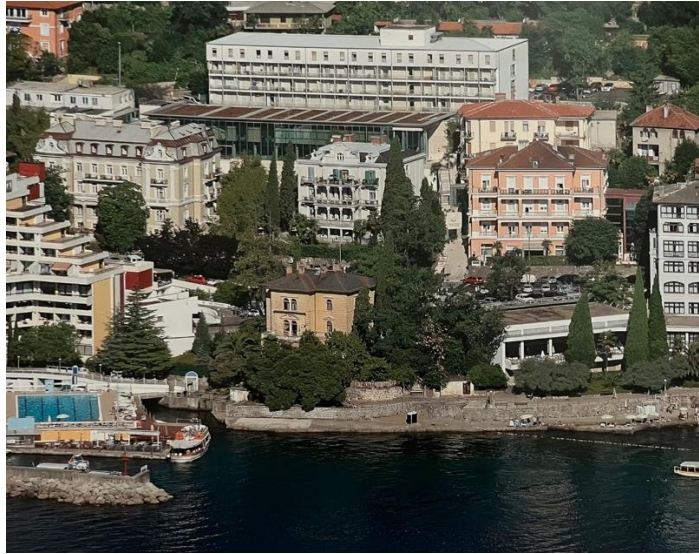
Slika 3. Kompleks zgrada Thalassotherapije