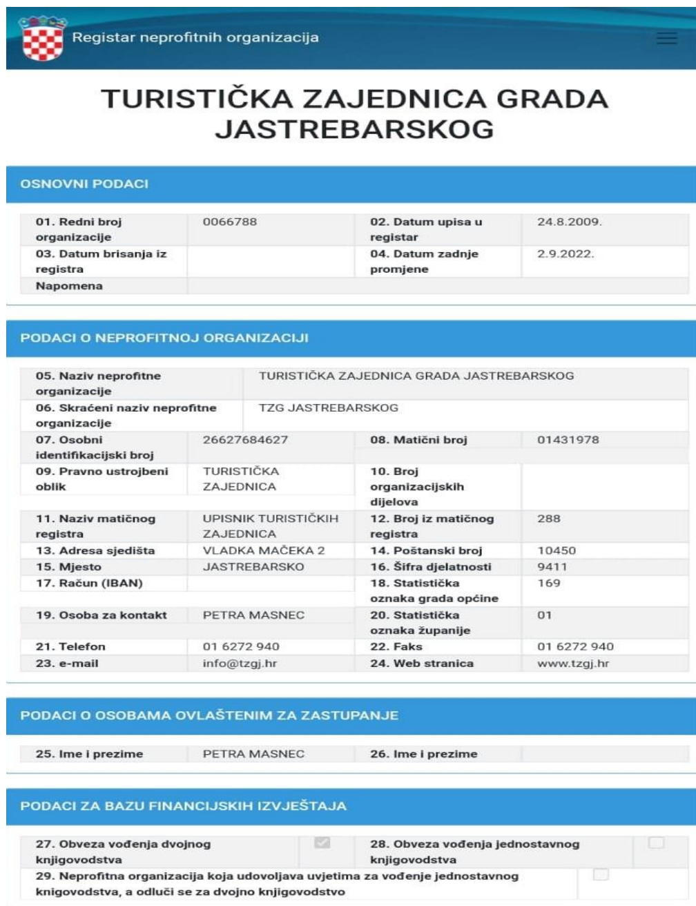
Slika1. Osnovni podatci o TZGJ iz RNO