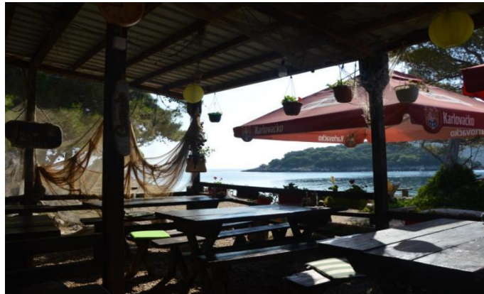
Slika 16. Konoba “Mrčara”

Na otočiću Mrčari nalazi se lovački dom “Morski konjic” u vlasništvu splitskog privatnika. U sklopu doma, na istočnoj strani otoka uz lukobran za pristanište brodova, nalazi se mala konoba “Mrčara” s vanjskom terasom gdje je moguće kušati mediteranska jela uz lokalne proizvode. U blizini restorana, nalaze se četiri drvene kućice s dva do četiri ležajeva, kupaonicama i pogledom na more, s mogućnost polupansiona. U središnjem dijelu otoka, na području bivše vojarnje, nalazi se prostor za paintball koji se iznajmljuje gostima tijekom godine. 40