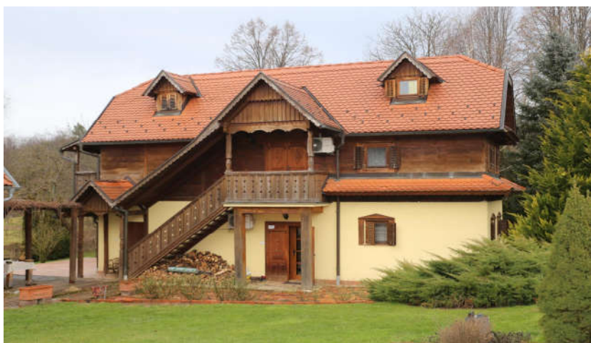
Slika 9. Kuća za odmor u selu Banski Grabovac