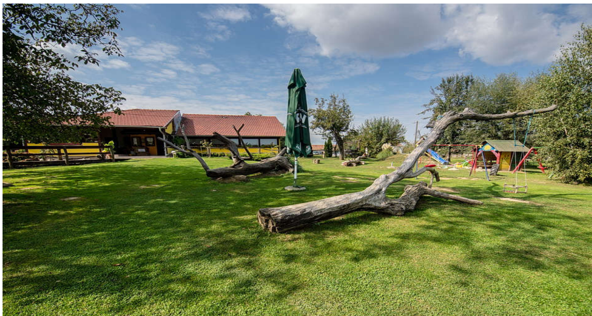
Slika 3. Seljačko domaćinstvo Jastrebov vrh

Seljačko domaćinstvo Jastrebov vrh smješteno je na obroncima najniže hrvatske planine, Bilogore, te je udaljeno samo 4 kilometra od grada Koprivnice. Posjetitelji mogu uživati u pogledu na Podravinu te prekrasne hrastove i bukove šume Bilogorskog gorja. Izletišta nudi bogat jelovnih domaćih autohtonih jela, od juha spremljenih sa sastojcima iz vlastita vrta, preko mesa iz domaćeg uzgoja pa sve do raznih slastica poput štrukla, butli, ali i palačinka od zobi, pira i ječma iz obližnjih polja. Imanje se prostire na 4 hektara livada, polja i šuma koje je moguće obići uređenim stazama pješke ili biciklima (Ministarstvo turizma 2015,78). Posebnost ovog imanja je malo ZOO prepun domaćih životinja te igralište sa poni konjima koje djeca mogu jahati. Također se preporuča posjet selu naivne umjetnosti Hlebine i rodnoj kući poznatog hrvatskog slikara Ivana Generalića.