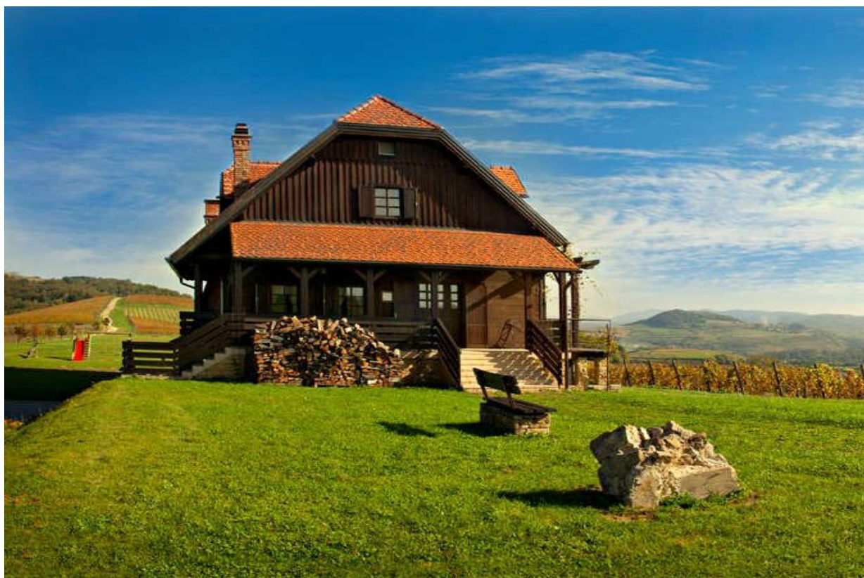
Slika 5. Vianrija Bolfan vinski vrh

Bolfan vinski vrh ekološka je vinarija koja nudi usluge smještaja te u svom sastavu ima restoran autohtone kuhinje spremljene na moderan način sa satojcima koji su uzgojeni isključivo od strane okolnih obiteljskih domaćinstava i manjih proizvođača u krugu od 40 kilometara. Vinarija se nalazi u malom mjestu Hrašćina koja je 30-ak kilometara udaljena od Varaždina, Zaboka i Svetog Ivana Zeline. Posjed krasi autohtona stara kuća smještena na vrhu brijega sa pogledom na planine Ivanščica, Medvednica i Kalnik, a sastoji se od restorana i soba za noćenje. Imanje je okruženo sa 20 hektara vinograda na nadmorskoj visini 250-380m s prosječnim nagibom 16-30 %, južne i jugoistočne ekspozicije (Ministarstvo turizma 2015, 79). Presentacija vinskog podruma i degustacija vina moguća je uz prethodnu najavu za grupe ili individualne goste dok je restoran otvoren za sve goste. Smještaj se nudi u pet dvokrevetnih soba kategoriziranim sa 4 zvijezdice te postoje planovi za danje proširenje i gradnju novog objekta.