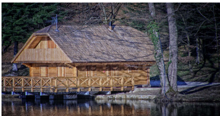
Slika10. Rbarska kuća Trakošćan