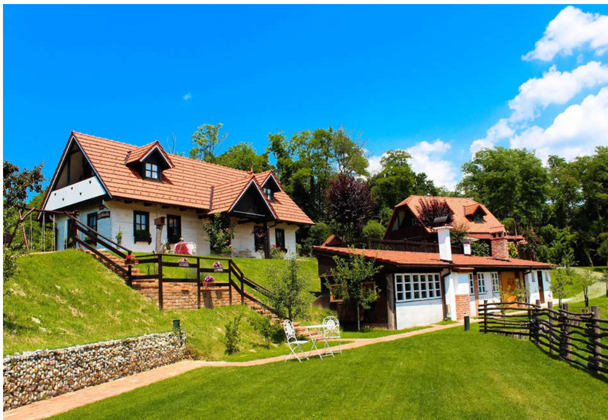
Slika 4. Agroturizam Zaboky selo

Seosko gospodarstvo Zaboky selo nalazi se neposredno uz sam centar grada Zaboka te samo 25 kilometara od Zagreba. Imanje je u obitelji Tkalčić dugi niz godina, a naziv imanja, Zaboky, datira još iz 15. st. kada je plemićka obitelj Zaboky živjela u staroj drvenoj kući podno kapelice sv. Antuna (Matijević-Sokol 1996, 17). Nalazi se na vrhu brežuljka iznad grada u potpunom miru i privatnosti okruženo veličanstvenim šumama. Zaboky selo se sastoji od 3 smještajna objekta i okolišem sa zasađenim voćnjakom i vinogradnom. Posebnost ovog gospodarstva je certifiirana ekološka proizvodnja koja se ističe u njihovoj gastro ponudi tradicionalno pripremljenih jela i domaćih rakija. Ponuda uključuje i sudjelovanje u sezonskim aktivnostima poput branju grožđa i jabuka. Lokacija je izrazito povoljna za turiste/posjetitelje zbog blizine Muzeja krapinskih neandertalaca i Muzeja seljačke bune u Gornjoj Stubici.