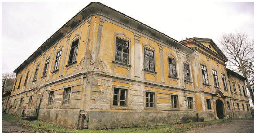
Slika 13. dvorac Oroslavlje Donje, Oroslavlje

Sjeverozapadna Hrvatska regija je izrazito niske iskorištenosti velikog turističkog potencijala. Ova regija ima dugu, bogatu i burnu povijest iza koje je ostalo mnoštvo dvoraca, vlastelinskih imanja i kurji koje su većim dijelom neobnovljene i neiskorišene te propadaju zbog utjecaja elemenata. Konkurentne regije u Sloveniji i Austriji od pojedinih dvoraca razvile su turizam čitave pokrajine i na taj način od jedne atrakcije stvorili desetke turističkih poduzeća i stotine radnih mjesta. Dvorac Bela I iz 18.st u mjestu Bela, dvorac Jalžabet iz 1774., dvorac Oroslavlje Donje i park obitelji Prpić iz sredine 18.st samo su neki od brojnih primjera propuštenog turističkog potencijala materijalne kulturne baštine (Marković 1975, 76).