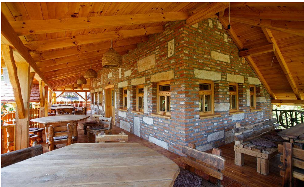
Slika 8. OPG Franić

U malom mjestu Cerje tužno, 10-ak kilometara od Ivanca i Varaždina, u podnožju planine Ivanščice smjestilo se „OPG Franić“, maleno poljoprivredno gospodarstvo specijalizirano za proizvodnju meda i medenih proizvoda. Snježana Franić vlasnica je imanja koje njeguje 35 godina staru tradiciju pčelarstva. Proizvodi su ekološkog uzgoja, a ponuda uključuje med, ocat od meda, medena rakija, medenjaci, med u saću i sok s medom. Ponudu upotpunjuje restoran smješten u tradicionalnoj drvenoj kući na imanju, a ponuda se temelji na lokalnim specijalitetima spravljenim od lokalnih namirnica (Krešić-Jurić i Rajković 2015, 106). Posjetitelji je omogućeno kušanje i kupnja svih poljoprivrednih proizvoda, upoznavanje s pčelama, koristima i ljekovitim svojstvima pčelinjih proizvoda, kao i rad s pčelama. Za najmlađe je instalirana prozirna staklena košnica koja im omogućuje promatranje pčela te samog procesa prikupljanja i stvaranja meda. Obilazak započinje informativnim filmom u trajanju od 45 minuta. Posjed je veličine 1,8 hektara, a okružen je predivnom netaknutom prirodom i prostranim šumama koje omogućuju gostima aktivnosti poput branja gljiva i kestena.