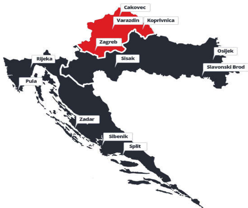
Slika2. Prikaz sjeverozapadne Hrvatske na karti RH i najbitnijih gradova regije na karti.