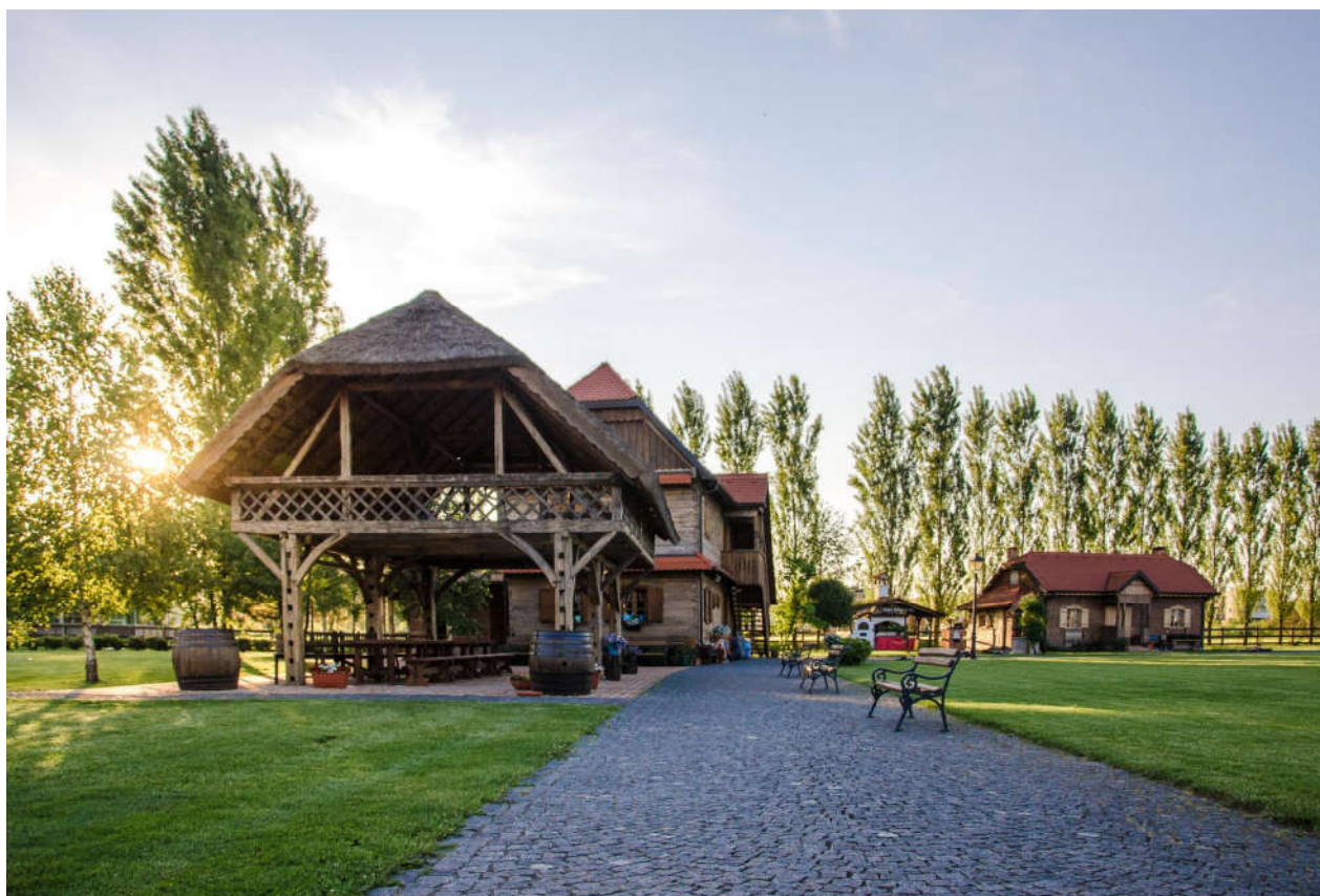
Slika 6. Etno farma Mirnovec

Etno farma Mirnovec je seosko imanje u vlasništvu obitelji Mirnovec, a nalazi se samo nekoliko minuta od centra Samobora te 15 minuta od Zagreba. Prostire se na čak 30 hektara na kojima se nalaze mnogobrojne restaurirane drvene kuće, restoran te konjički klub. Restoran Baraž dio je vikend ponude, a serviraju se domaći tradicionalni obroci pripremljeni od lokalnih namirnica ekološkog uzgoja. Na imanju se također nalazi Konjički klub Mirnovec, najsuvremeniji konjički klub u Hrvatskoj i regiji čija se ponuda sastoji od šetnji na konju, škole jahanja, dječjeg jahačkog kampa i pansiona za konje. Uz navedeno, na farmi se organiziraju vjenčanja pa čak i turniri u preponskom jahanju čime se dodatno upotpunjuje turistička ponuda i čini Mirnovec jednim od najcjenjenijih objekata ove vrste u regiji (Buljan, 2021, 4)