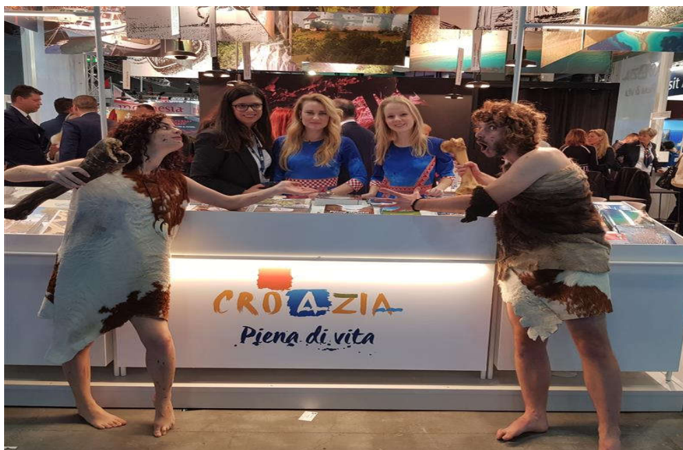
Slika 11. Sajam BIT u Milanu, štand HTZ