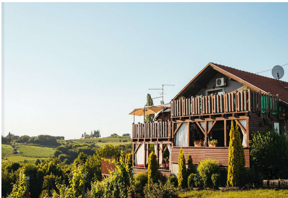
Slika 7. Vinarija Dvanajščak Kozol

Dvanajščak je poljoprivredno gospodarstvo sa 20 godina starom tradicijom čija ponuda uključuje vinariju i restoran. Nalazi se u mjestu Sveti Juraj na Bregu, a posebnost lokacije je nadmorska visina od 344.4 metra čineći je najvišom točkom u Međimurju. Ugostiteljska ponuda bazirana je na lokalnim specijalitetima i tradicijskom načinu pripreme jela poput tradicionalnoga mesa z tiblice, sira s vrhnjem te izobilja domaće hrane međimurskoga kraja. Vinarija je temelj ponude, a vina su među najcjenjenijima u hrvatskoj sa izrazito širokom ponudom koja se sastoji od: vino Pušipel (moslavac), graševina, pinot bijeli i crni, chardonnay, traminac i rajnski rizling namirnica (Ministarstvo turizma 2015,98). Posjetiteljima se nudi upoznavanje vinograda od strane vlasnika, obitelji Dvanajščak, a uz imanje postoje brojne staze za šetnju, trčanje i bicikliranje kroz prekrasan brežuljkasti krajolik.