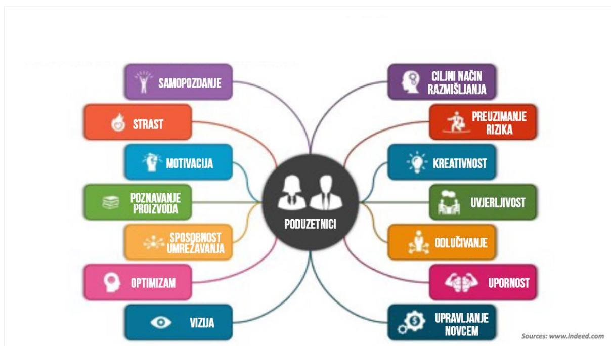
Shema 2.: Karakteristike uspješnih poduzetnika