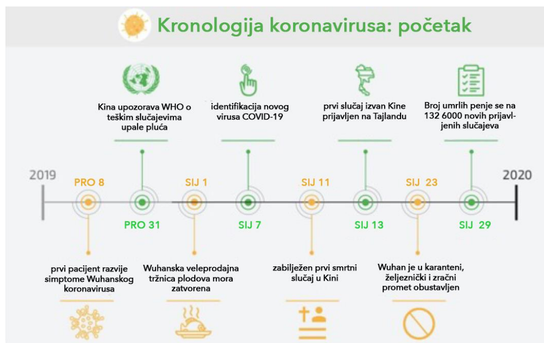
Shema 3.: Početak pandemije Covid – 19