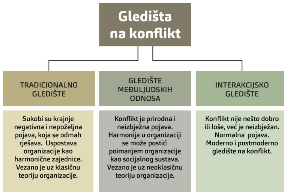
Shema 1. – Različiti pristupi i gledišta na konflikt