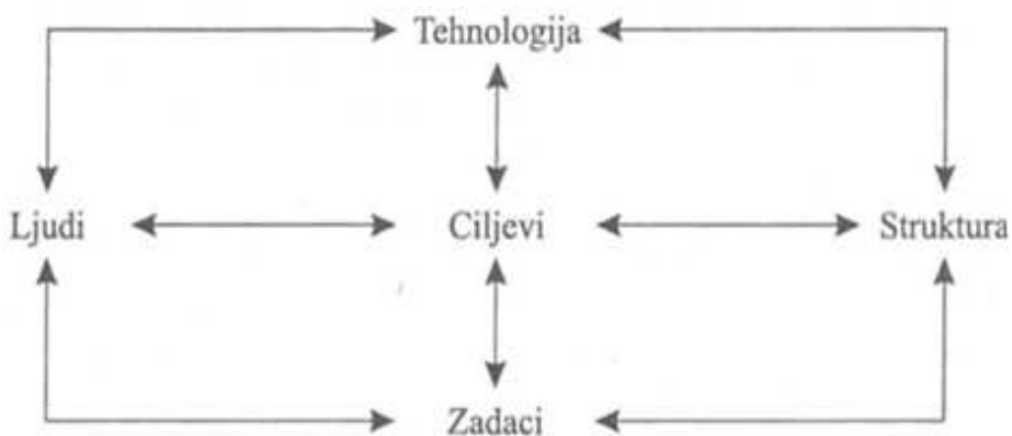
Slika 2. Međusobni odnos unutarnjih čimbenika organizacije