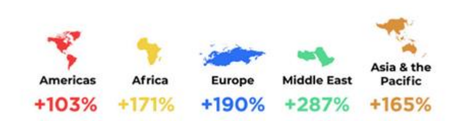
Slika 1. Prikaz međunarodnih dolazaka u globalnim regijama

Procjenjuje se da su velike boginje, kolera, kuga, gripa i COVID-19 usmratile 300 do 500 milijuna ljudi. Zbog velikog napretka u medicini (razvoj antibiotika i cjepiva, javnozdravstvenih uvjeta) uspješno su eradicirane velike boginje, a kuga i kolera javljaju se samo u manje razvijenim područjima (Jerković, 2022). Međutim, i dalje je prisutna opasnost od izbijanja novih pandemija. Pandemija COVID 19 pokazala je koliko smo (ne)spremni u borbi s pandemijom. Prema UNWTO analizi podataka, 2022. godine 96% globalnih destinacija bilo je pod ograničenjem dolazaka, 50 milijuna ljudi izgubilo je posao 2020., a BDP turizma iznosio je gubitak od 4 bilijuna američkih dolara za vrijeme pandemije. Tek u razdoblju od siječnja do srpnja 2022. u usporedbi s 2021. godine, međunarodni dolasci porasli su za 172%, s pozitivnim brojevima iz svake globalne regije prikazane na Slici 1.