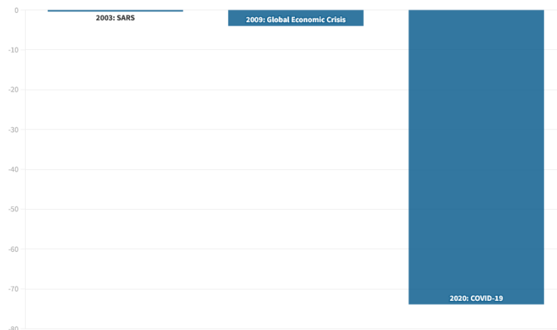
Grafikon 1. Pad globalnih turističkih dolazaka (usporedba)

Na grafikonu ispod prikazan je pad broja turističkih dolazaka na globalnoj razini, u usporedbi s ostalim kriznim razdobljima.