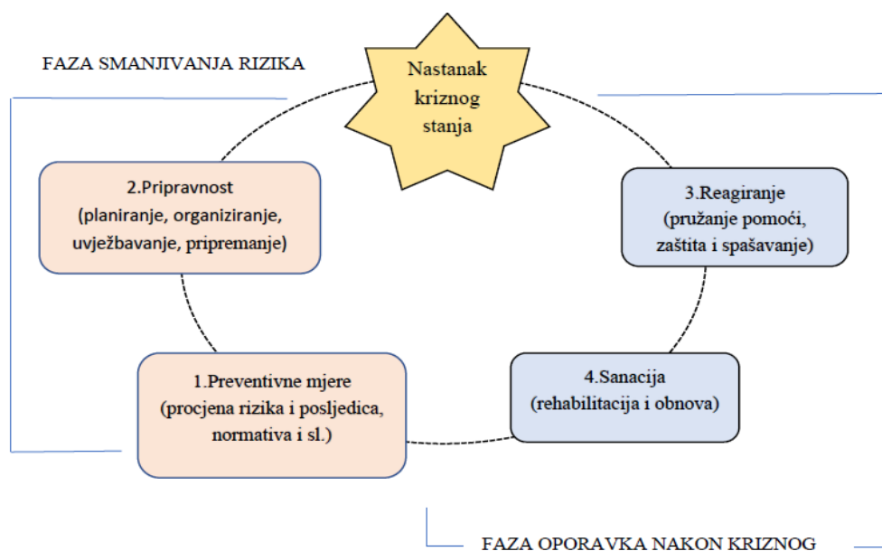
Slika 2. Upravljanje u kriznim uvjetima

Nakon završetka krize neophodno je provesti analizu provedenih aktivnosti. Cilj analize je identificirati dobre i loše prakse te ih primijeniti u budućim kriznim situacijama. Kontinuirano usavršavanje plana i procedura ključno je za bolje suočavanje s budućim kriznim situacijama.