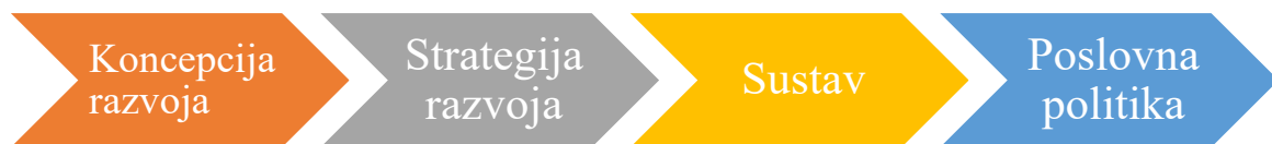
Slika 1: Model koncepcije razvoja