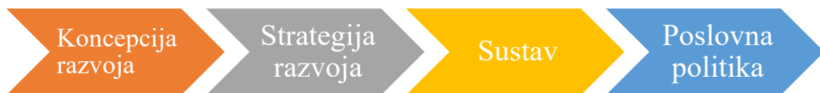
Slika 1: Model koncepcije razvoja