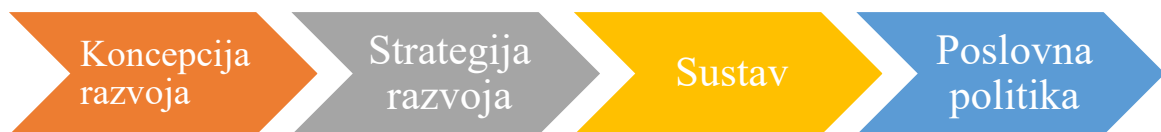
Slika 1: Model koncepcije razvoja