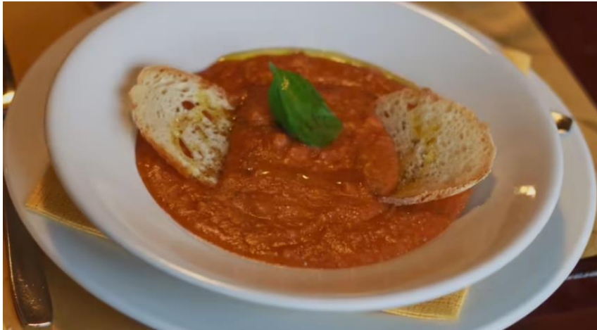
Slika 9. Prikaz toskanske juhe od rajčice

rajčice, ali svi se slažu oko korištenja ovih sastojaka: stari kruh, rajčice, češnjak, malo čili papričice, bosiljak i sirovo ekstra djevičansko maslinovo ulje za posluživanje jela. 39