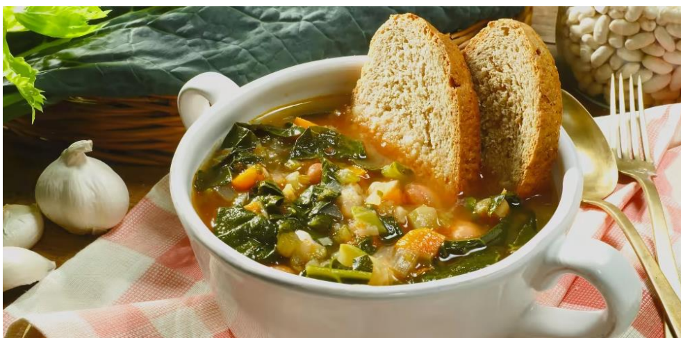
Slika 7. Ribollita

2. Ribollita - Ribollita je jedno od najpopularnijih zimskih jela u Toscani i juha koja sadrži različite vrste kupusa, graha, luka i mrkve: savršena mješavina za hladno godišnje doba. To je tipično zimsko jelo ne samo zato što se poslužuje jako vruće, već i zato što je glavni sastojak crni kupus koji raste zimi. Podrijetlo je jednostavne seljačke juhe s vrlo jednostavnim, ali istovremeno hranjivim i izvornim sastojcima. I u ovom receptu, kao i za juhu od rajčice, glavni sastojak je stari kruh. Sam naziv sugerira kako se jelo konzumiralo: jelo se dan nakon pripreme, zagrijavalo se u loncu s ekstra djevičanskim maslinovim uljem i potom ponovno kuhalo, što ga razlikuje od jednostavne juhe od kruha. Kupus koji se koristi za ribollitu mora biti uzgojen pod zimskim mrazom da bi bio istinski ukusan. Osim glavnih sastojaka, jelo se završava prelivanjem ekstra djevičanskim maslinovim uljem i svježim lukom narezanim na vrh. 37