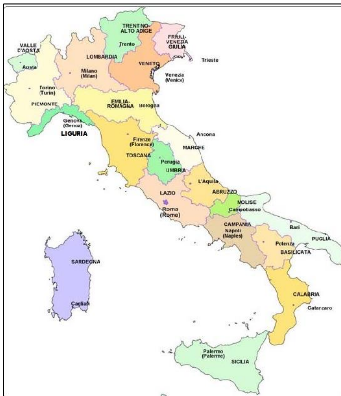
Slika 1. Prikaz položaja Toscanu u Italiji

Italija se sastoji od 20 regija, od kojih pet ima zasebnu autonomiju: Furlanija-Juljska krajina, Južni Tirol, Sardinija, Sicilija i Valle d'Aosta. Ove regije imaju veću autonomiju u upravljanju svojim unutarnjim poslovima u usporedbi s drugim regijama. Ostale regije, koje nemaju posebnu autonomiju, uključuju Abruzzo, Apuliju, Basilicatu, Emiliju – Romanju, Kalabriju, Kampaniju, Lacij, Liguriju, Lombardiju, Marke, Molise, Pijemont, Toscanu, Umbriju i Veneto (Slika 1). 5