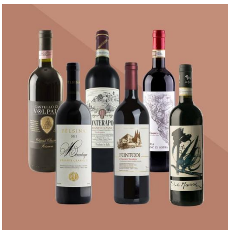
Slika 10. Prikaz raznih vrsta vina Chianti

Danas je Chianti i dalje simbol vinske izvrsnosti i vodeća turistička atrakcija u toskanskoj regiji. Chianti Classico dobiva predikat vrhunskog vina kontroliranog porijekla te se na buteljama može naći oznaka DOC. Postoje jasne razlike među vinima Chianti, s varijacijama kao što su Riserva, Chianti Superiore i Chianti Classico Gran Selezione. Vina Riserva ističu se po tome što moraju odležati dulje od 38 mjeseci, u usporedbi s tipičnih četiri do sedam mjeseci za obični Chianti. Chianti Superiore karakterizira niži urod grožđa, veći udio alkohola i suhi ekstrakt. Iako Chianti Classico ne nosi predikat Superiore, prepoznat je po svojoj jedinstvenoj oznaci kao Chianti Classico Gran Selezione (Slika 10). 51