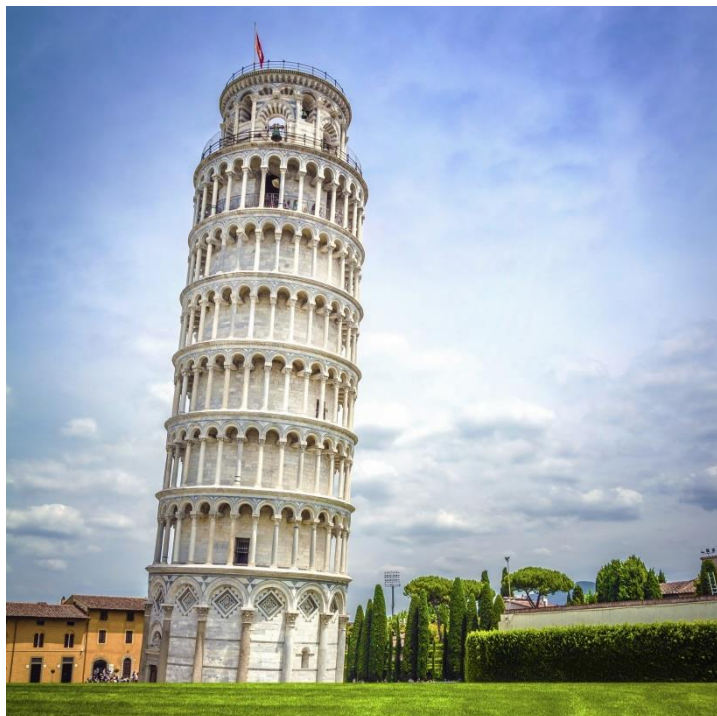
Slika 4. Prikaz Kosog tornja u Pisi

takve konstrukcije. Iako je nagnutost predstavljala prijetnju urušavanja tornja, on je prije 15-tak godina osiguran kako bi se spriječila katastrofa i kako bi turisti mogli uživati u ovom jedinstvenom arhitektonskom čudu (Slika 4). 17