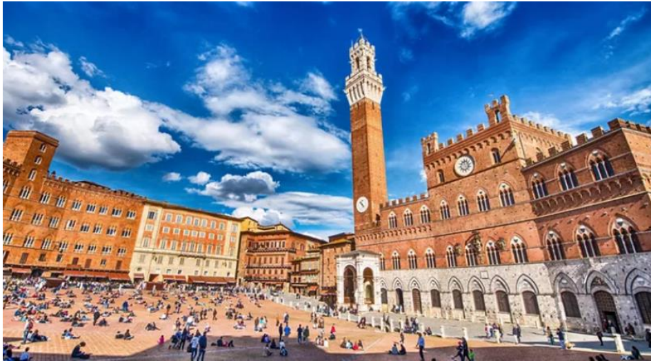
Slika 5. Prikaz središnjeg trga Piazza del Campo u Sieni

svog središnjeg trga, Piazza del Campo, odakle se strme i uske ulice spuštaju prema podnožju brežuljka (Slika 5).