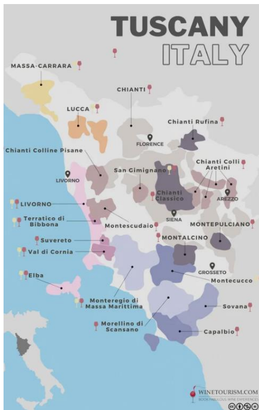
Slika 13. Prikaz vinskih cesta u Toscani