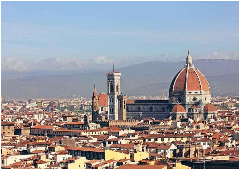
Slika 3. Prikaz povijesnog djela centra Firenze

utjecaj odražava u bogatoj kulturno-povijesnoj baštini grada (Slika 3). Ova je iznimna važnost priznata 1982. godine kada je UNESCO uvrstio povijesno središte Firence na popis svjetske baštine. Svojom arhitekturom, muzejima poput Pittija i Uffizija, vrtovima, obrazovanjem, glazbom, gastronomskom ponudom, modom i mnogim drugim resursima, Firenca privlači ogroman broj posjetitelja svake godine, čineći je jednom od najposjećenijih destinacija u Italiji. Često nazvana "talijanskom Atenom", Firenca ponosno nosi ovaj epitet zbog svog iznimnog kulturnog značaja.