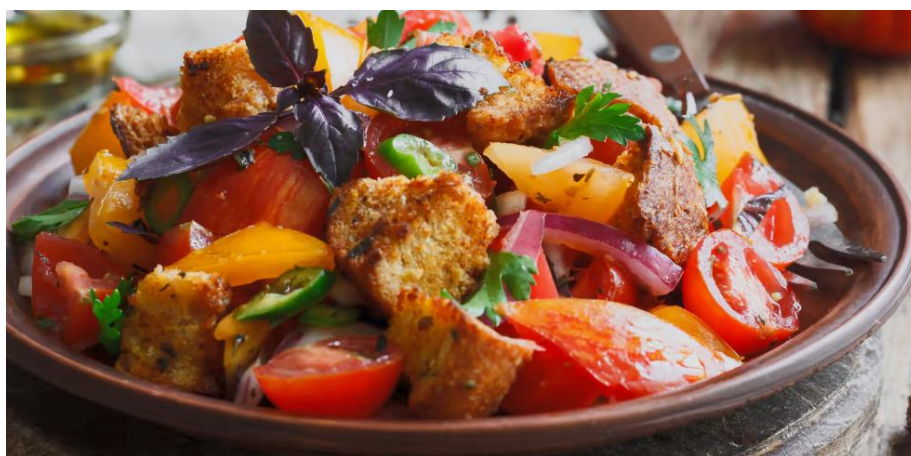
Slika 8. Panzanella

3. Panzanella - Panzanella je jedinstveno tradicionalno toskansko jelo koje se priprema od starog kruha, crvenog luka i bosiljka, sve začinjeno uljem, octom i soli. Ovo jelo spominje nitko drugi nego Boccaccio, podrijetlom iz Certalda, sredinom 14. stoljeća i Bronzino, slavni firentinski renesansni slikar, koji je napisao pjesmu u slavu ovog jela. Za ovaj recept kruh se mora ostaviti kruh da se namače u vodi desetak minuta, zatim ga ocijediti i dodati ostale sastojke, koji osim već navedenih mogu uključivati rajčice i krastavce i mnoge druge varijante koje se mijenjaju prema kuharu. kuhati. Jelo treba poslužiti hladno, zbog čega je jedno od tipičnih jela toskanskog ljeta. 38