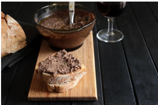
Slika 6. Crni krostini s jetricama