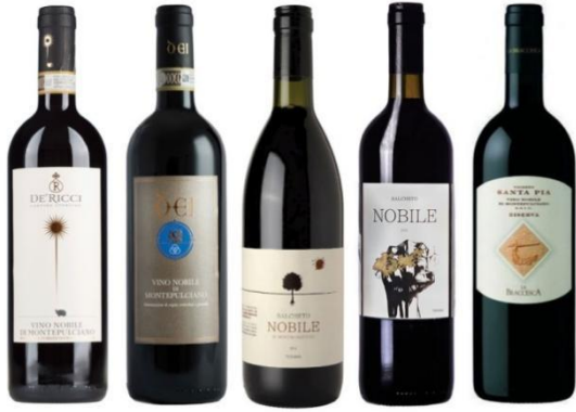
Slika 12. Prikaz sorti vina Vino Nobile di Montepulciano