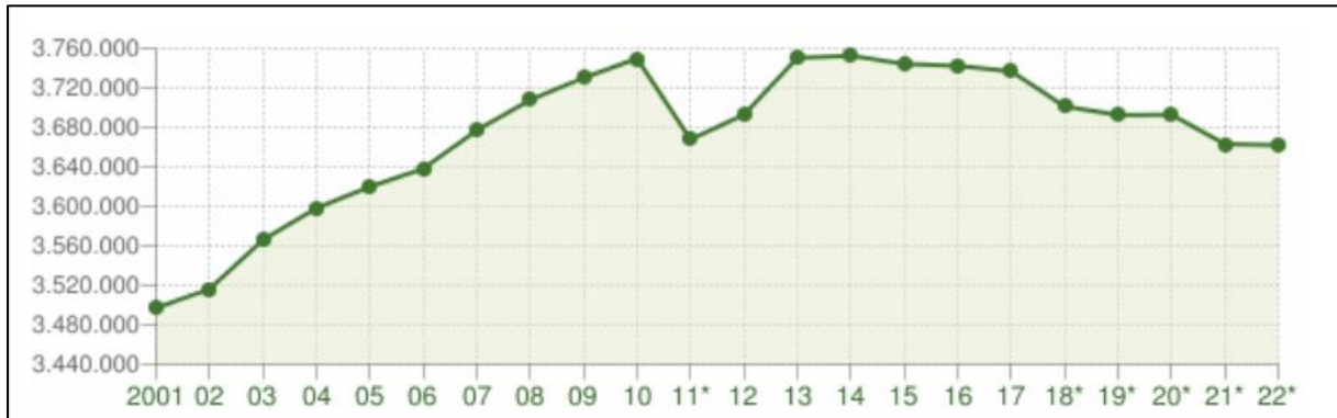
Slika 2. Prikaz demografskih kretanja regije Toscana

gospodarsku aktivnost, što se odrazilo i na demografske trendove u Toscani. Populacija Toscare u 2021. godini iznosila je 3.663.191 stanovnika, što predstavlja pad od 29.674 u odnosu na prethodnu godinu (Slika 2). 13