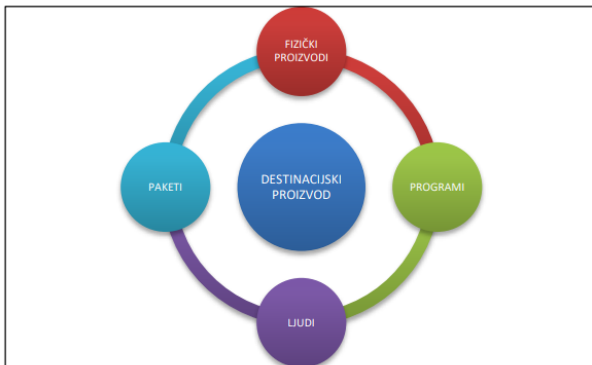
Slika 1. Destinacijski proizvod