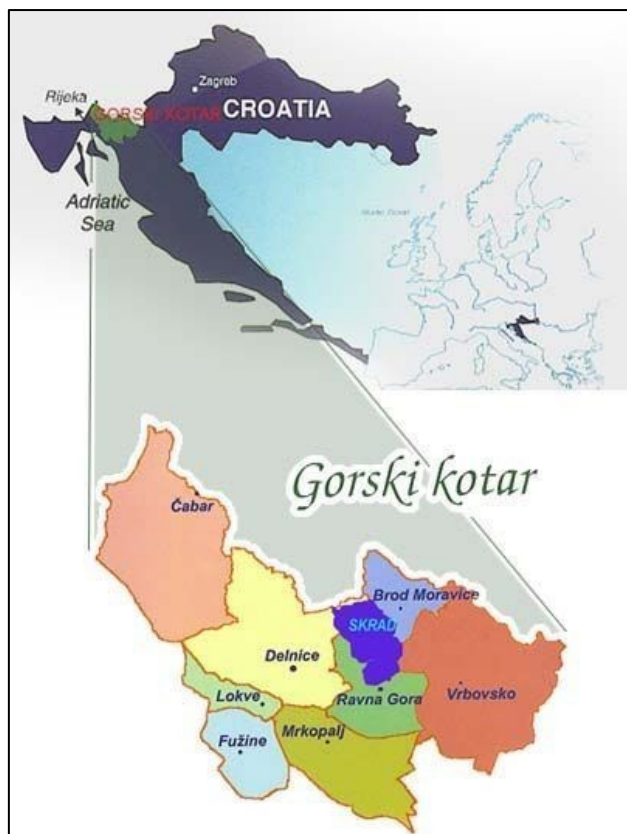
Slika 2. Pozicija i podjela Gorskog kotara

Gorski kotar je smješten između mediteranske i kontinentalne Hrvatske i ispod alpskog pojasa. On je poznat kao zelena oaza Europe i Hrvatske. Središte je grad Delnice, a od ostalih većih mjesta izdvajaju se gradovi Vrbovsko i Čabar te općine Brod Moravice, Lokve, Fužine, Ravna Gora, Skrad i Mrkopalj.