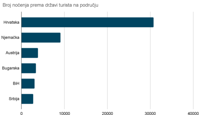
Slika 2. Broj noćenja prema državi u gradovima Kutini, Popovači, Novskoj i naselju Lipovljani u 2023. godini,

U ukupnom broju noćenja na razini područja nešto veći udio imaju strani turisti - 51,7 % u odnosu na domaće 48,3 %. Turistički promet najveći je u Kutini, a zatim u Novskoj, Popovači pa Lipovljanima koji su ujedno i najmanja općina s najmanjim brojem kreveta. Na slijedećem grafu prikazan je broj noćenja turista prema državi turista.