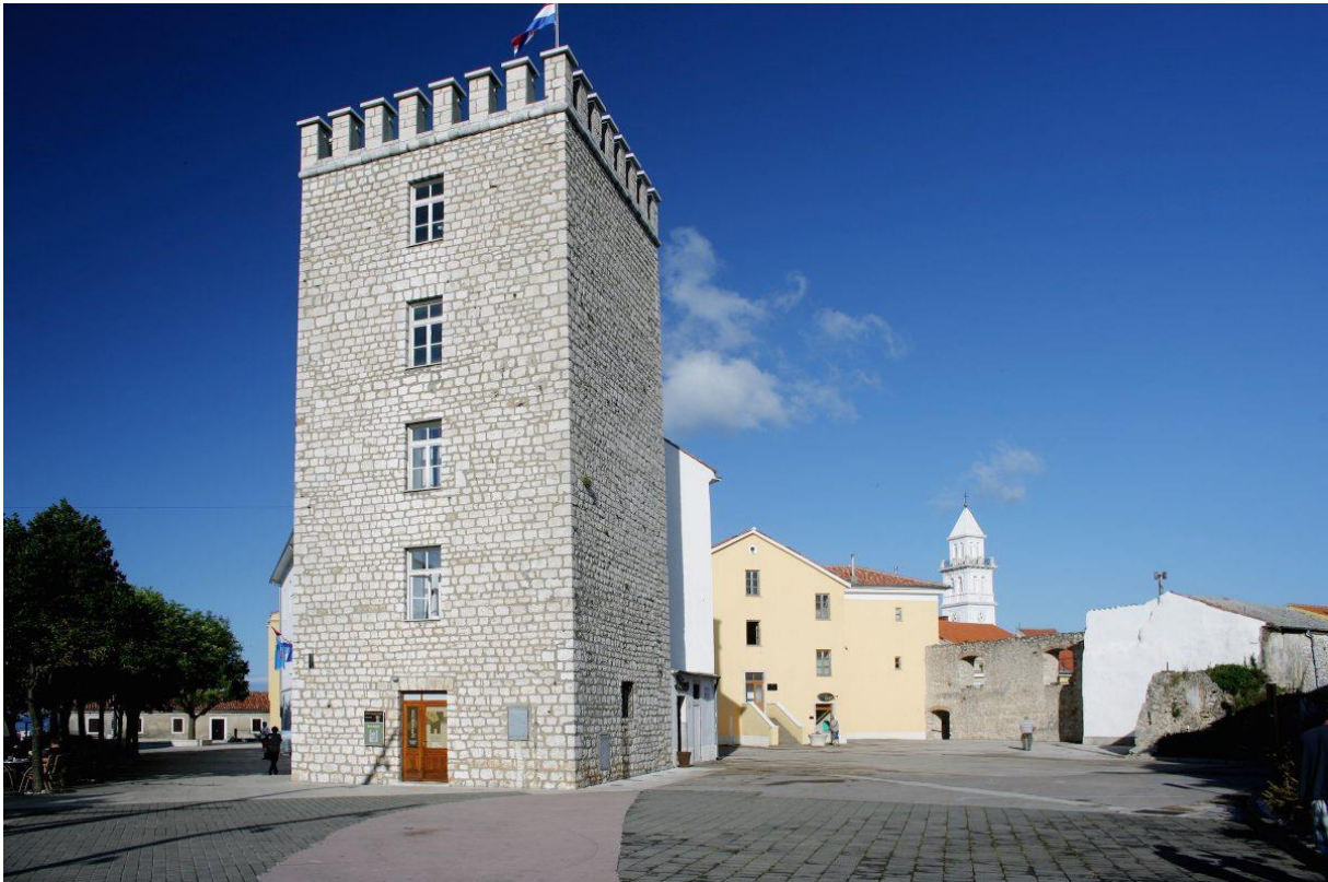
Slika 14 Kvadrac