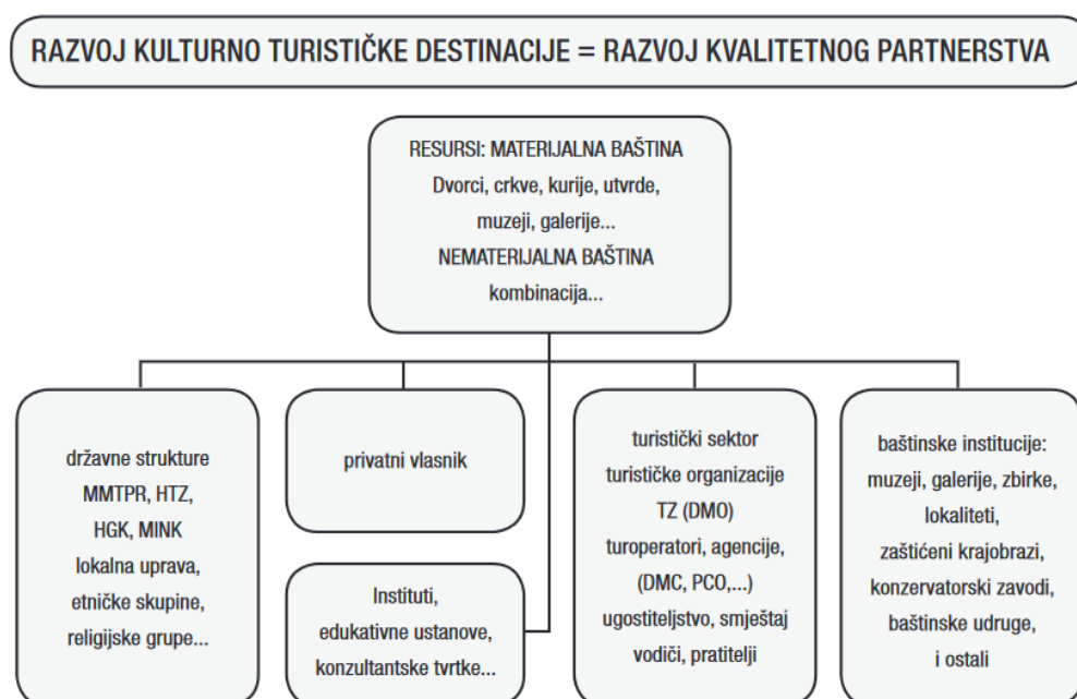
Shema 1 Razvoj kulturno - turističke destinacije