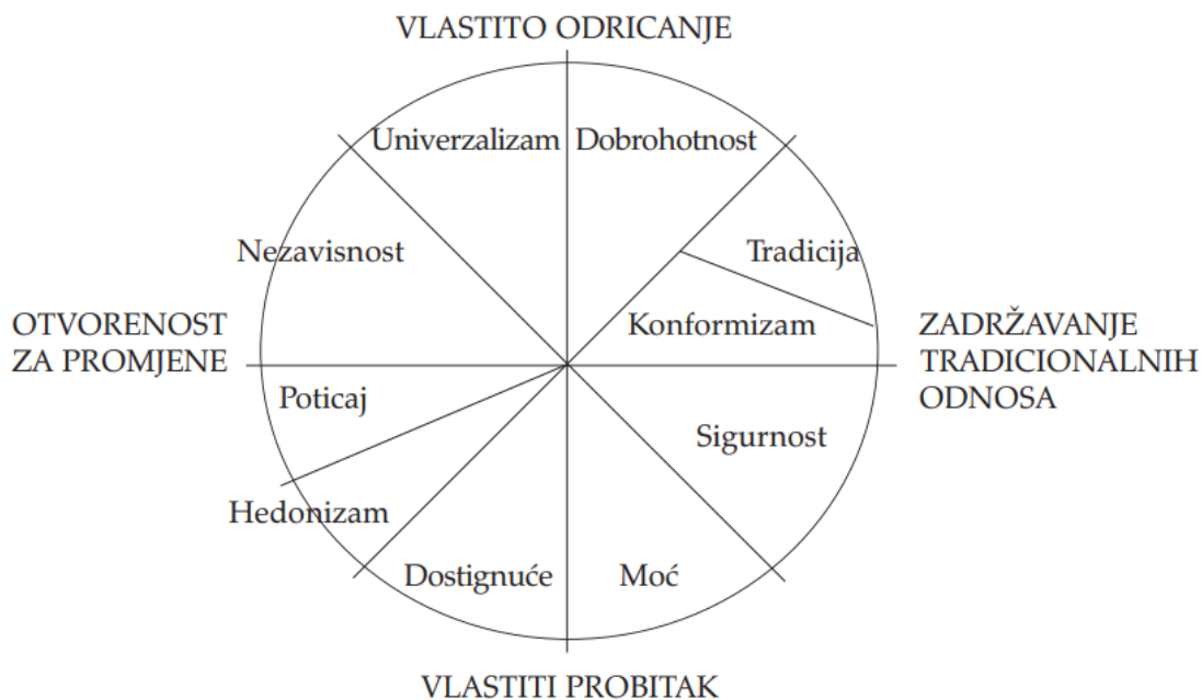
Slika 2. Struktura vrijednosnog sustava

Na kružnom prikazu komplementarni tipovi vrijednosti smješteni su jedan uz drugi, dok se konfliktni tipovi nalaze nasuprot jedan drugom.