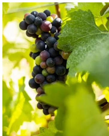
c) Pinot meunier