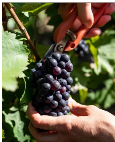
a) Pinot noir

Pinot meunier je također sorta iz Francuske, ali iz pokrajine Champagne . Unatoč tome, sorta se uzgaja te je vrlo popularna i u drugim dijelovima svijeta poput Njemačke, Kalifornije u SAD-u te na Novom Zelandu, gdje se također koristi za proizvodnju pjenušavih vina. Naziv vuče porijeklo od francuske riječi „mlinar“ jer donja strana njegovih listova ima bijeli, praškast izgled koji je asocijacija za brašno za rukama mlinara. Sorta je vrlo prilagodljiva i prepoznatljiva po tome što dobro podnosi hladnije klimatske uvjete. Od pinota crnog se razlikuje po tome što prije pupa i ranije sazrijeva te to čini veliku razliku jer je samim time manje osjetljiva na proljetni mraz, koji je itekako čest u francuskoj regiji Champagne . Pinot meunier ima tendenciju ka voćnim aromama u kojoj dominiraju okusi crvenog bobičastog voća i trešanja. U Francuskoj je jedna od tri sorte za proizvodnju pjenušavih vina. U Hrvatskoj nije toliko popularna niti zastupljena ( Champagne.fr n.d., Grape varieties ).