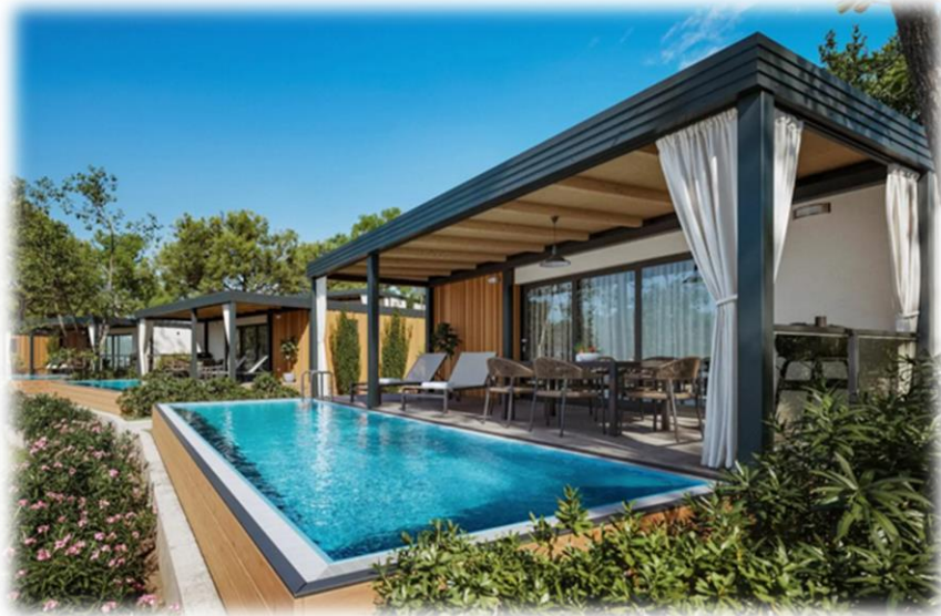
Slika 3 Lanterna Premium Camping Resort u Poreču