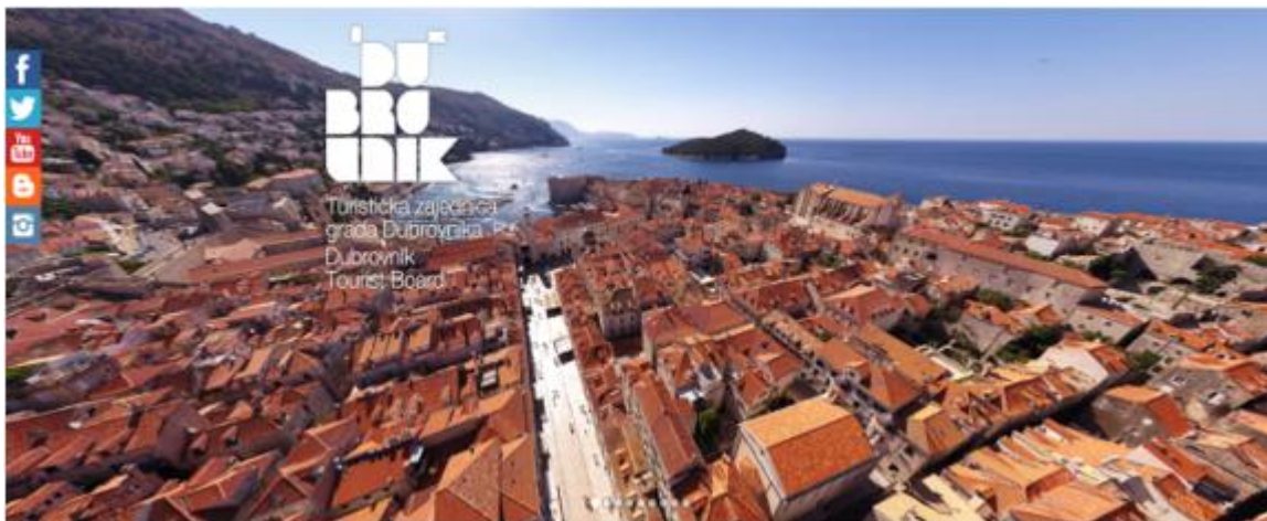
Slika 1. Naslovnica web stranice TZGD – a