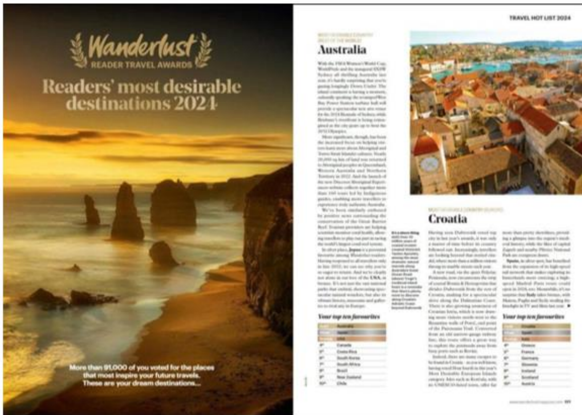
Slika 3. Offline oglašavanje u Wanderlust travel magazinu