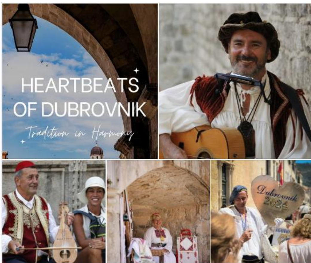
Slika 2. Facebook objava - Dubrovački zabavljači i vjerni čuvari tradicije