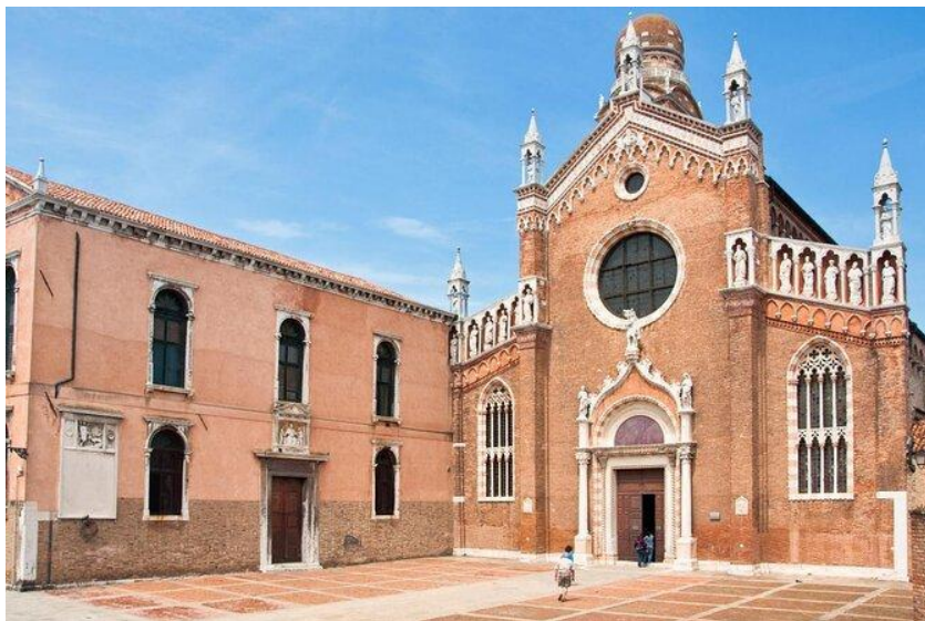
Slika 12: Crkva Madonna dell'Orto (preuzeto 15.lipnja 2024.)

Crkva Madonne dell'Orto bila je rodna župa Tintoretta i stoga obiluje nizom njegovih djela, ali i njegovom grobnicom. Podignuta je sredinom 14.stoljeća po naredbi Tiberija da Parme, koji je ondje i pokopan. Visoki oltar crkve okružuju dva remek-djela iz 1546.godine- dramatični "Posljednji sud" i starozavjetni prizor "Štovanje zlatnog teleta". Tintoretto je pokopan u apsidnoj kapelici na desnoj strani crkve, zajedno sa svoje dvoje djece. 50