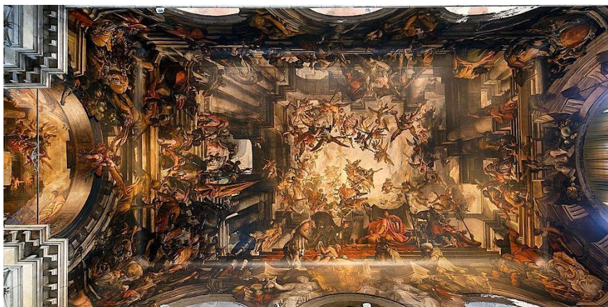
Slika 13: Strop crkve San Pantalon (preuzeto 15.lipnja 2024.)