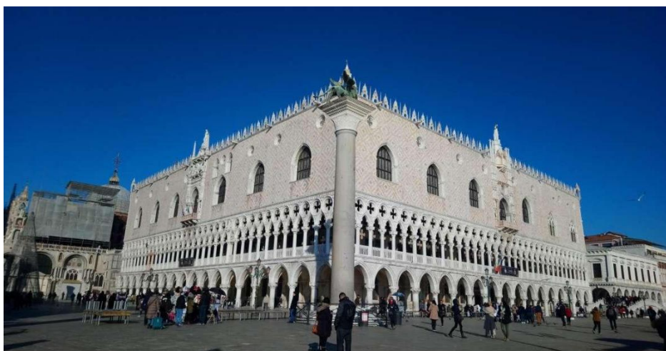
Slika 3: Duždeva palača (preuzeto 15.lipnja 2024.)