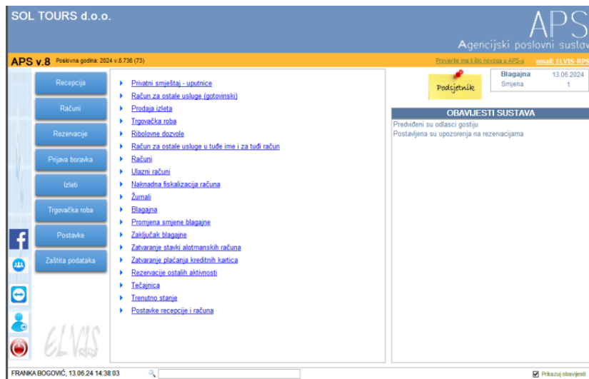
Slika 1: Agencijski poslovni sustav