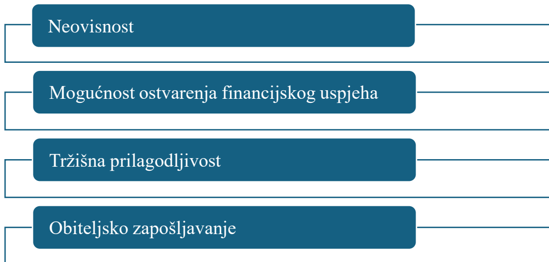
Shema 3: Prednosti malih turističkih agencija