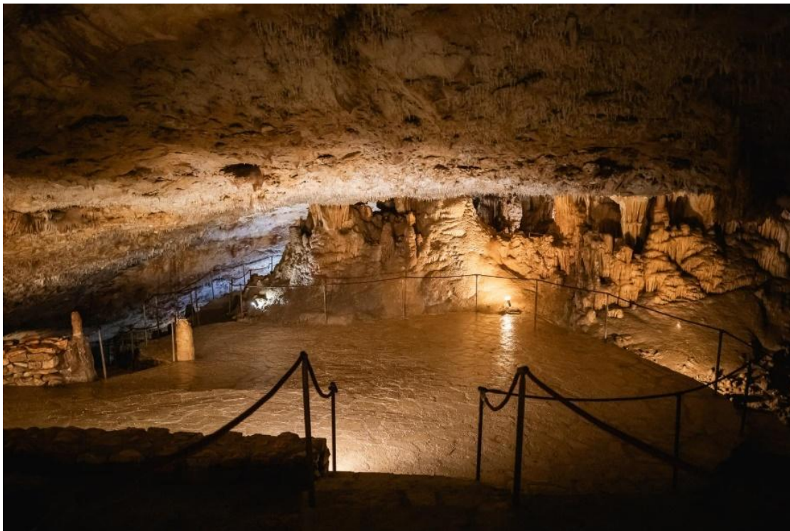
Slika 8. Unutrašnjost špilje Mramornice