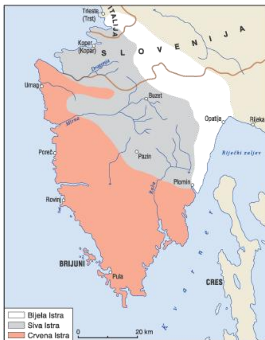
Slika 1. Podjela Istre na bijelu, sivu i crvenu