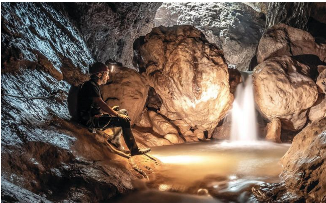
Slika 6. Pazinska jama