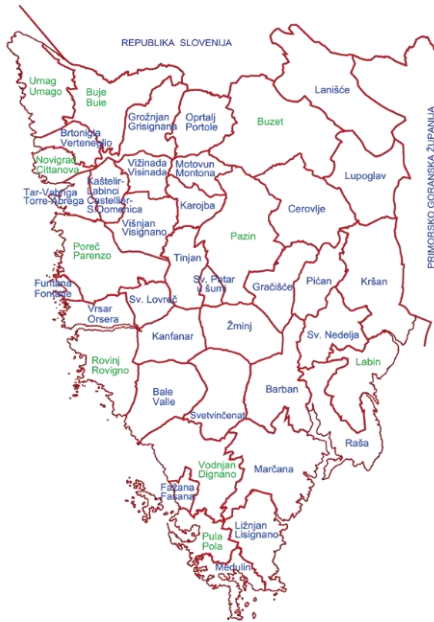
Slika 3. Podjela Istarske županije po općinama i gradovima