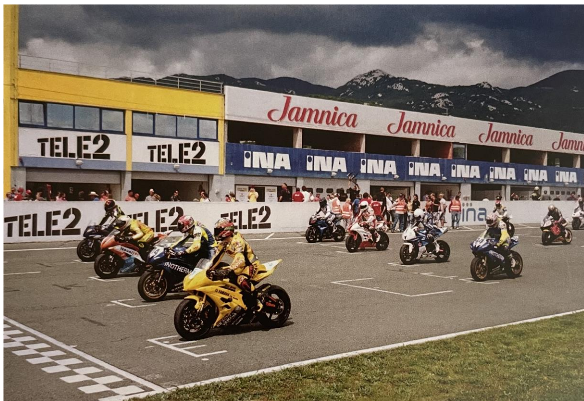
Slika 4. Alpe Adria Cup- pred start utrke.

pobjeda, čime je uvršten među pet najuspješnijih vozača na ovoj stazi. 57 Na slici 3. prikazan je start utrke na Alpe Adria kupu.