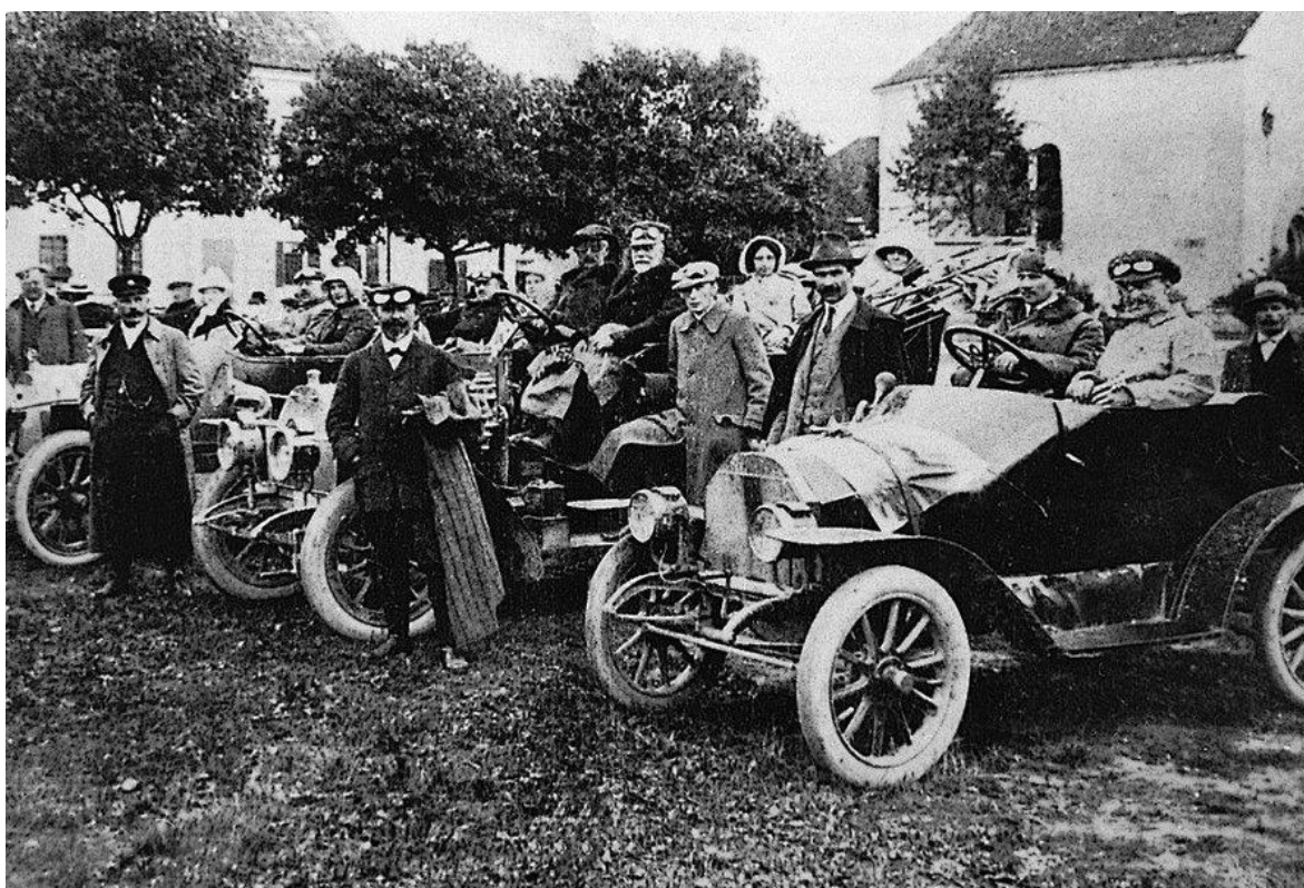
Slika 1. Automobilizam, sudionici prve automobilske utrke za prvenstvo Hrvatske održane na relaciji Zagreb-Varaždin-Zagreb 08.09. 1912.