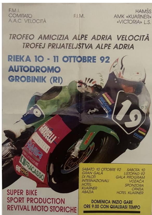
Slika 3. Prvi plakat za utrku Alpe Adria- Trofej prijateljstva