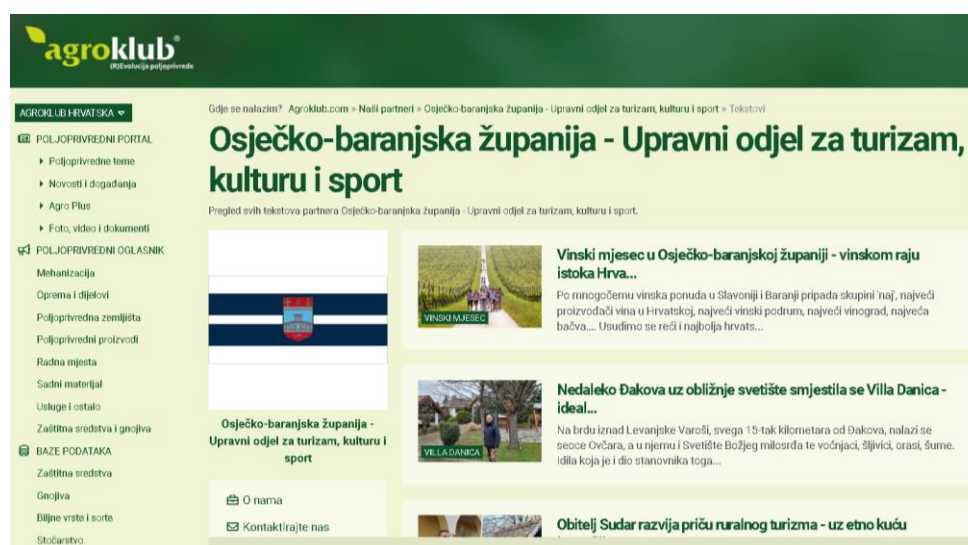
Slika 4: Agrokлуб portal

Osječko-baranjska županija razvila je digitalnu platformu posvećenu promociji ruralnog turizma u regiji. Na ovoj platformi posjetitelji mogu pronaći informacije o seoskim gospodarstvima, aktivnostima na selu, tradicionalnim manifestacijama i lokalnim proizvodima. Kroz implementaciju SEO strategija i promociju putem društvenih mreža, platforma je postala ključni resurs za putnike koji traže autentična iskustva u ruralnom okruženju.