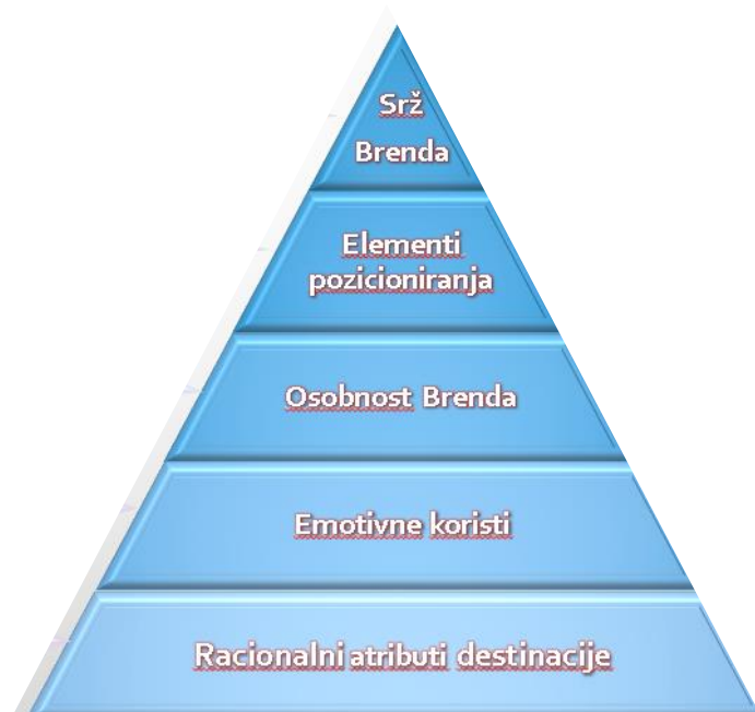
Slika 1: Piramida brenda

analizu tržišta, brend može jasno definirati svoju jedinstvenu vrijednost i ciljeve. Nakon analize tržišta, slijedi faza definiranja identiteta brenda. Ovdje se detaljno razmatra što brend predstavlja, kome je namijenjen i tko je ciljna skupina potrošača. Identitet brenda treba biti usklađen s ciljevima brenda te jasno komuniciran kako bi privukao pravu publiku i izgradio lojalnost. Treća faza, razvoj vizualnog identiteta, uključuje stvaranje vizualnih elemenata koji će predstavljati brend, kao što su logo, boje i naziv. Vizualni identitet treba odražavati osobnost i vrijednosti brenda te biti privlačan i prepoznatljiv potrošačima. Posljednja faza u izgradnji brenda je razvoj verbalnog identiteta. Ovdje se definiraju slogani, simboli i poruke koje će brend koristiti u komunikaciji s potrošačima. Verbalni identitet treba biti dosljedan s vizualnim identitetom i jasno prenositi ključne poruke i vrijednosti brenda. 29