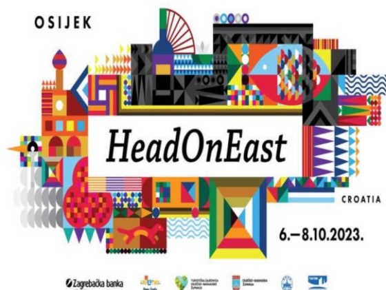
Slika 2: HeadOnEast Osijek