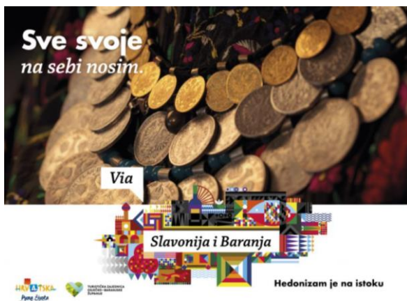
Slika 5: Kampanja "Via Slavonija i Baranja"