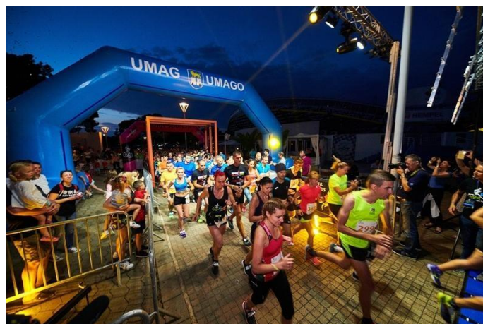
Slika 4: Umag Night Run