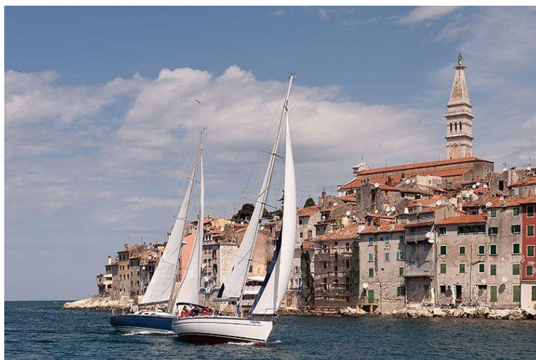
Slika 5: Regata Pesaro-Rovinj-Pesaro