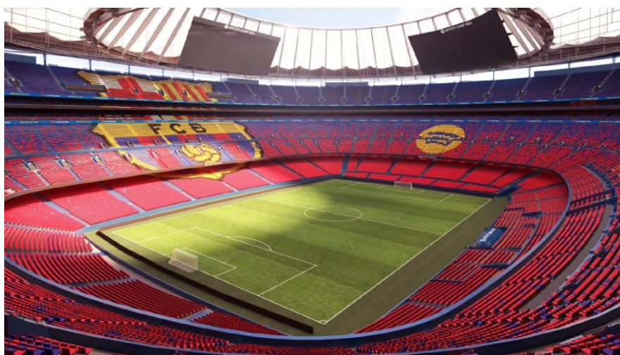
potify Camp Nou