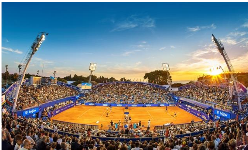
Slika 3: ATP Croatia Open Umag

Ovo su samo neki od mnoštva sportskih događaja u gradu Umagu, ali treba napomenuti da grad nudi raznovrsne sportske događaje tijekom cijele godine, što doprinosi njegovoj reputaciji kao destinacije za sportski turizam. Ovi događaji privlače različite profile posjetitelja, od profesionalnih sportaša do rekreativaca, te značajno doprinose lokalnoj ekonomiji i promociji grada.