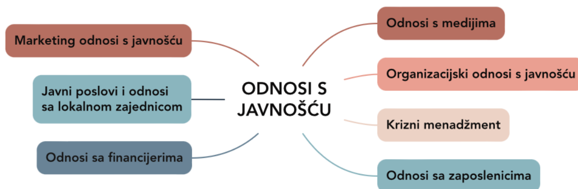
Slika 2. Podjela oblika odnosa s javnošću