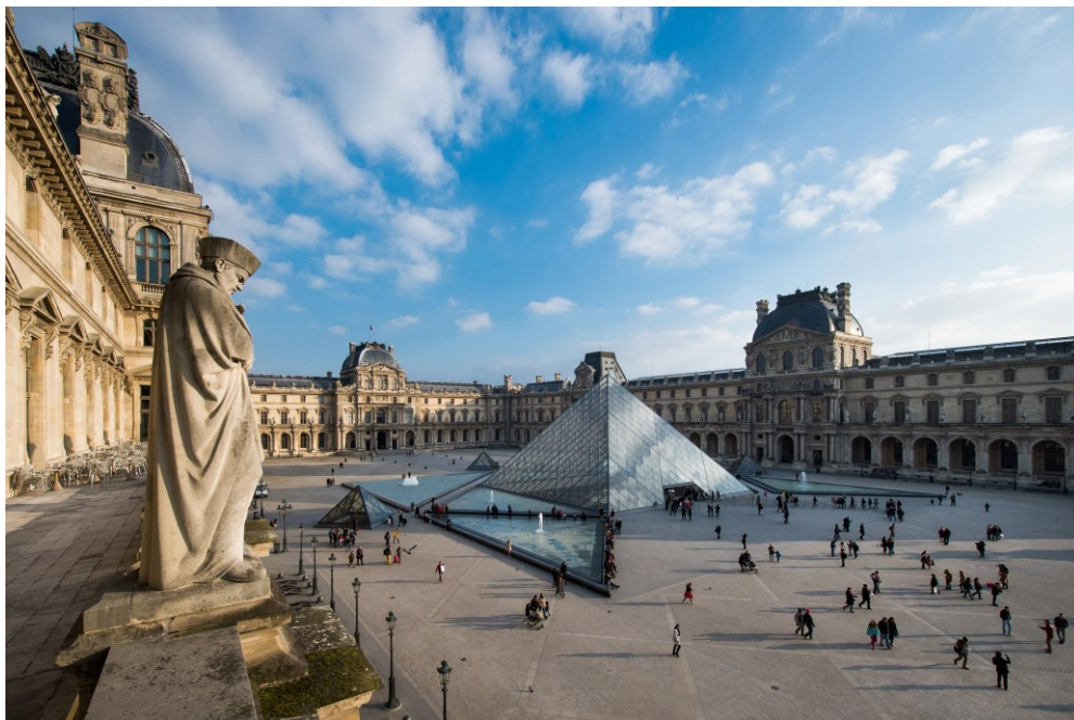
Slika 2. Muzej Le Louvre