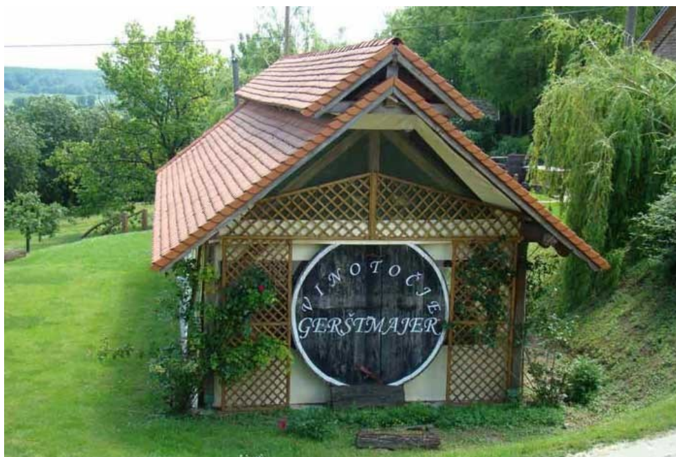
Slika 5. Vinotočje Gerštmajer

Vinotočje Gerštmajer posluje kao obiteljsko poduzeće specijalizirano za seoski turizam i proizvodnju vina iz vlastitih vinograda. Kako je vinogradarstvo i vinarstvo dugogodišnja tradicija obitelji Gerštmajer, Mihalj Gerštmajer se kao četvrta generacija od malih nogu uključio u proces proizvodnje vina. Vinogradi Gerštmajer strateški su smješteni za uzgoj grožđa i proizvodnju vina. Vinogradi imaju bogatu povijest, još iz vremena prije Rimljana, a nalaze se na područjima sa višestoljetnom tradicijom proizvodnje vina. Prostirući se na 11 hektara plodne zemlje, vinogradi pružaju dovoljno prostora za proizvodnju vrhunskih vina. Idealna veličina vinograda za relativno poznatog vinara je između 10 i 20 hektara s proizvodnjom od 50 do 70 tisuća boca vina. Vinska ponuda Gerštmajera kreće se od suhih do slatkih vina, a sorte graševine, rajnskog rizlinga, traminca i chardonnaya prepoznate su kao vrhunska vina, posebno poznata po karakteristikama kasne berbe. Vinarija nudi svojim posjetiteljima mogućnost kušanja raznih vina, obilaska vinograda, vinskih podruma. Također, posjetitelji mogu organizirati vjenčanja i druge manifestacije u manjim grupama. 54