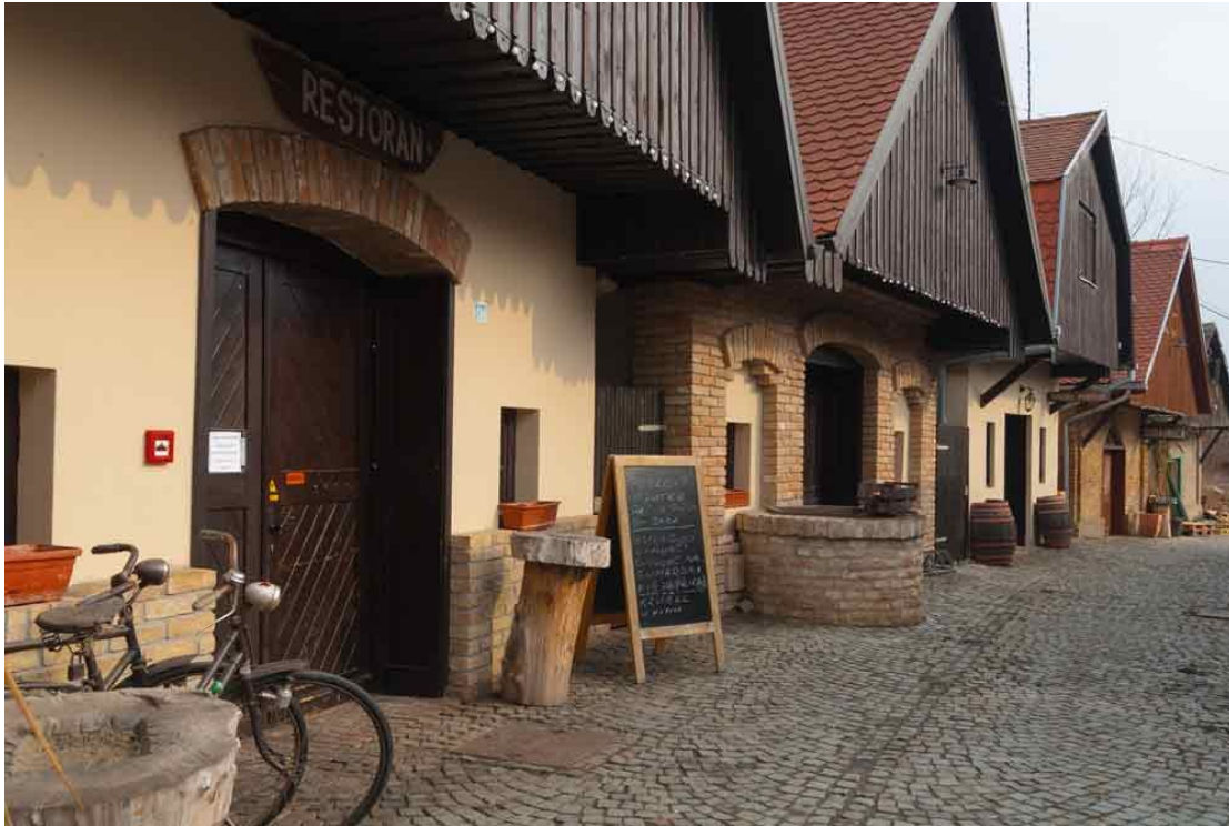
Slika 7. Restoran vinarije Josić

prostor za poslovne sastanke i prezentacije. Za sve posjetitelje restorana organiziraju besplatnu degustaciju vina u kušaonici te prema željama i šetnju vinskim podrumima. 60