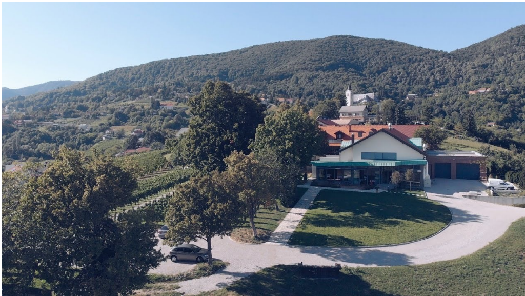
Slika 8. Vinarija Korak

U paketu „grand“ posjetitelji mogu degustirati 9 biranih vina. Gosti mogu uživati u vinu i zalogajima u vinariji ili na terasi restorana, u sjeni stoljetnih lipa, usred vinograda. Stručni vinar vodit će kušanje, pružajući detaljno objašnjenje vina i načina na koji se proizvode. Ova vođena degustacija namijenjena je i stručnjacima iz industrije i vinskim entuzijastima. Dodatno, posjetitelji imaju mogućnost obilaska vinskog podruma i obiteljskog imanja. Cijena ovog iskustva je 62 € po osobi. Trajanje tura i degustacija je 1-2 sata, dok je kapacitet od 2-40 osoba. Pored toga, vinarija nudi mogućnost organizacije konferencija i sastanaka za grupe do 32 osobe. 63