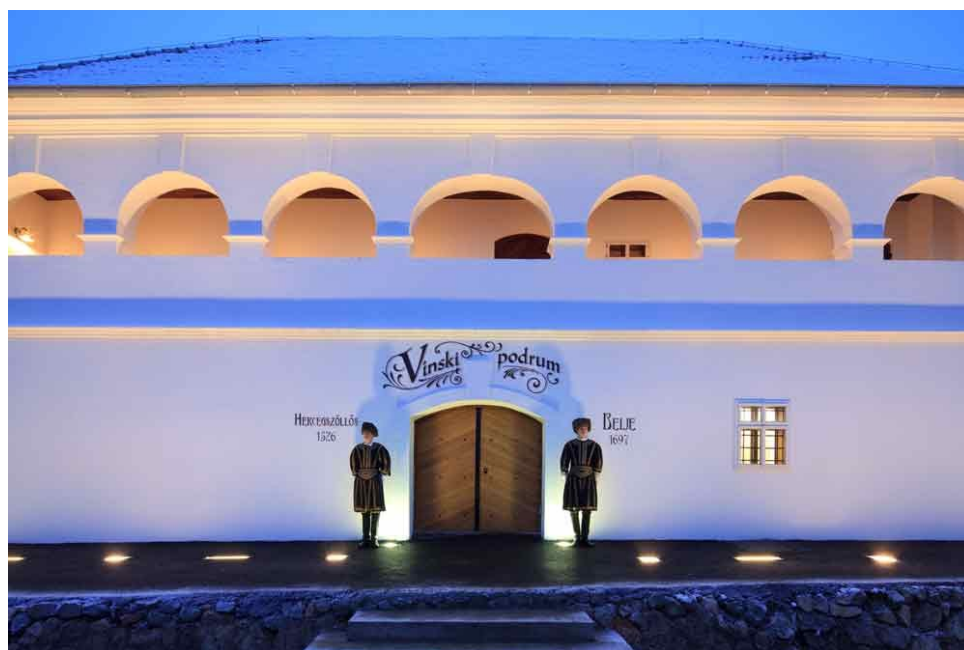
Slika 4. Vinski podrum Belje

Vinski podrum Belje, smješten u srcu baranjskog mjesta Kneževi Vinogradi, iskopan je u brdu prije pet stoljeća. Skrivena iza svojih čvrstih vrata, ova izvanredna građevina obuhvaća tri razine prostranih prolaza obrubljenih bačvama izrađenim od najfinije slavonske hrastovine. Na glasu je kao najveći i najimpresivniji vinski podrum u Baranji, ali i široj regiji gdje takve podrume nazivaju "aligatorima", podrum Belje nudi obilazak svakih sat vremena kako za organizirane grupe tako i za individualne posjetitelje. Osim razgledavanja podrume, gosti mogu sudjelovati u degustaciji vina, kušati suhomesnate delicije i kušati razne sireve. 53