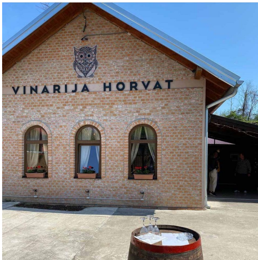
Slika 6. Vinarija Horvat