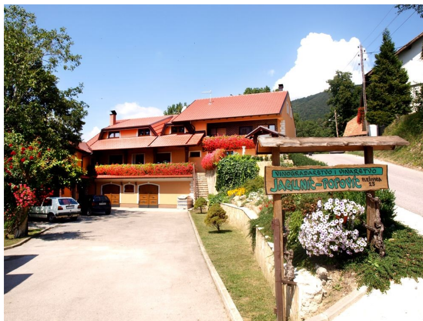
Slika 9. Vinarija Jagunić

Vinarija nudi tri vrste usluga, tj. vođene degustacije, domjenke i proslave, te eno-gastro turizam. Vođene degustacije su namijenjene za posjetitelje koji žele pobliže upoznati vina koje vinarija proizvodi. Vinarija nudi mogućnost organizacije domjenaka i raznih proslava. Restoran u kojem se organiziraju domjenci i proslave imaju oko 80 mjesta u zatvorenom i 40 mjesta na otvorenom prostoru. Otvaranjem Plešivičke vinske ceste 2000. godine vinarija je renovirala stari obiteljski podrum i počela sa izgradnjom degustacijske dvorane u neposrednoj blizini vinarije. Nedugo zatim, dvoranu su proširili na 80 mjesta te 40 mjesta na prekrasnoj otvorenoj terasi i stavili u funkciju dodatne gastronomske ponude koja je bazirana na domaćim specijalitetima Plešivačkog kraja. Sve namirnice koje pripremaju proizvode sami ili ih dobavljaju od lokalnih proizvođača. 65