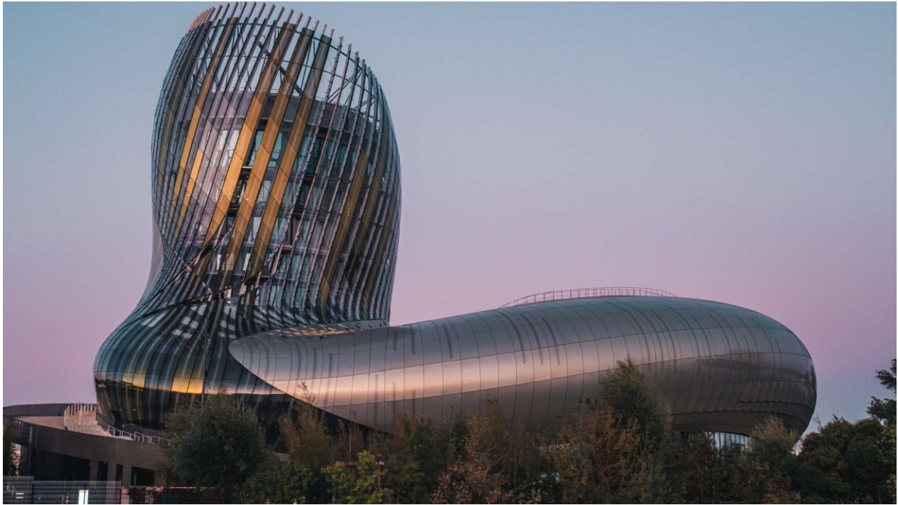
Slika 3. La Cité du Vin